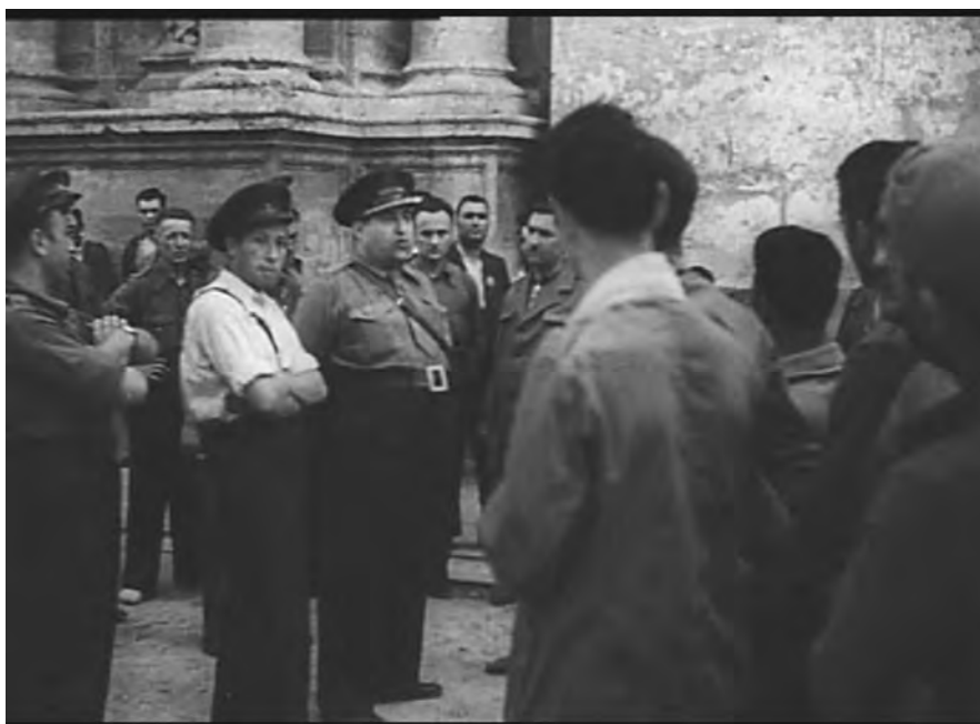
Fig. 13. Il sottocommissario di Agitazione, Stampa e Propaganda fa visita a uno dei prigionieri italiani ( Nuestros prisioneros )