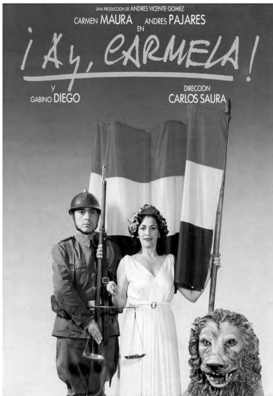
Fig. 17. Locandina del film ¡Ay, Carmela! (1990)