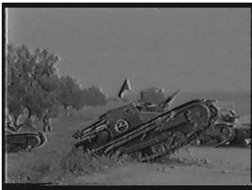
Figg. 5-6. Carri armati utilizzati dal CTV ( La toma de Gijón )