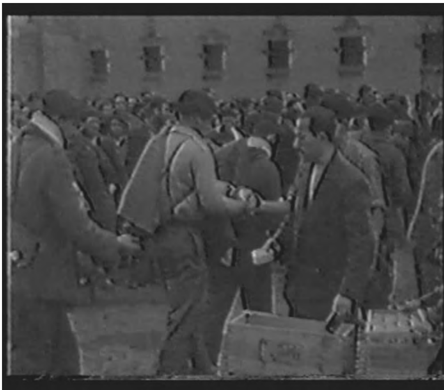
Figg. 7-9. Prigionieri ( La toma de Gijón )