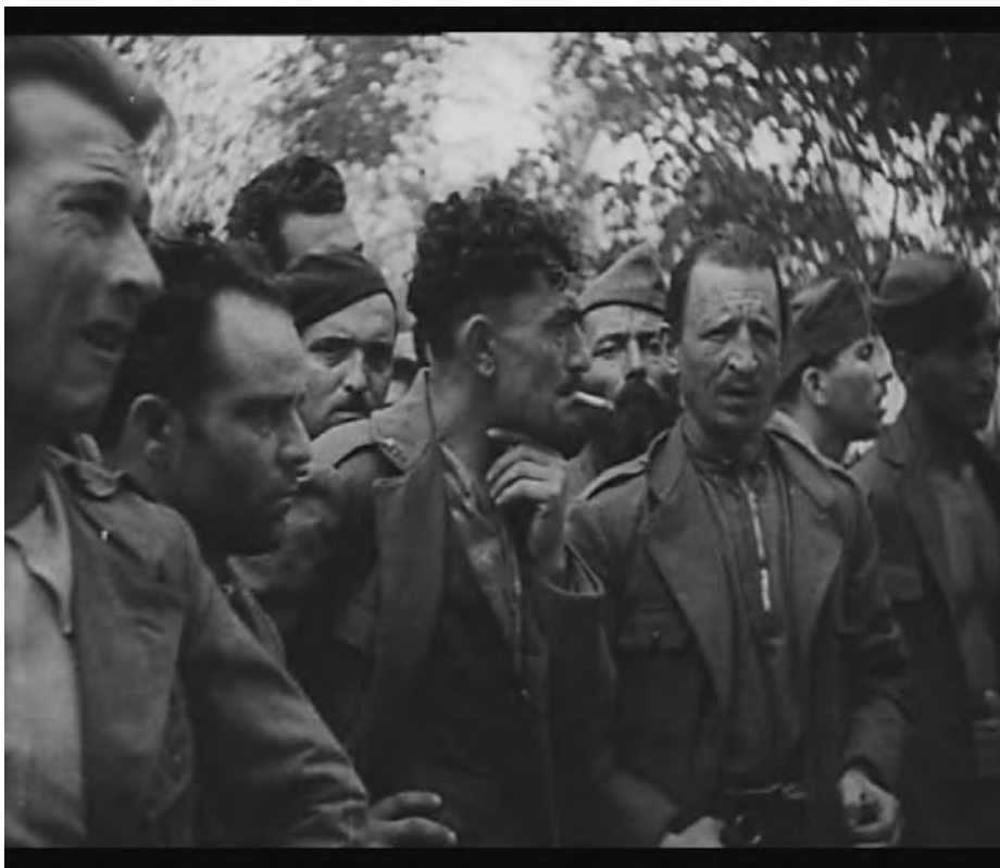
Fig. 14. Prigionieri italiani del CTV ( Nuestros prisioneros )