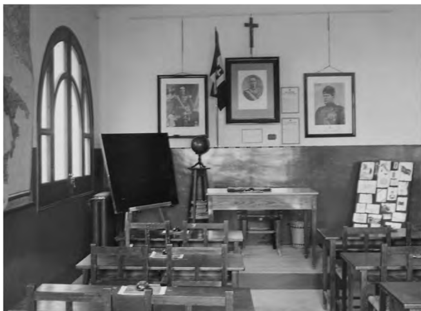
Imag. 2. Detalle del aula elemental de la escuela italiana de Barcelona en 1924 (ASMAE, AS, 1923-1928, b. 656).