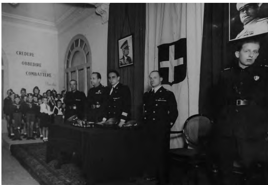
Imag. 16. Comando de la GILE de Barcelona, agrupado bajo el lema mussoliniano «Crederre, obbedire, combattere», 04 de noviembre de 1939.