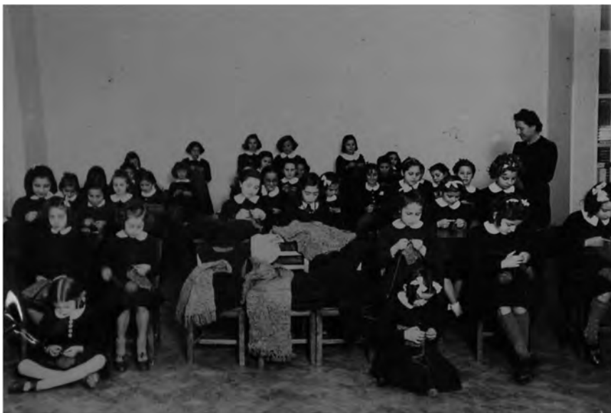
Imag. 19. Clase de labores en la escuela elemental de Madrid, febrero de 1943.