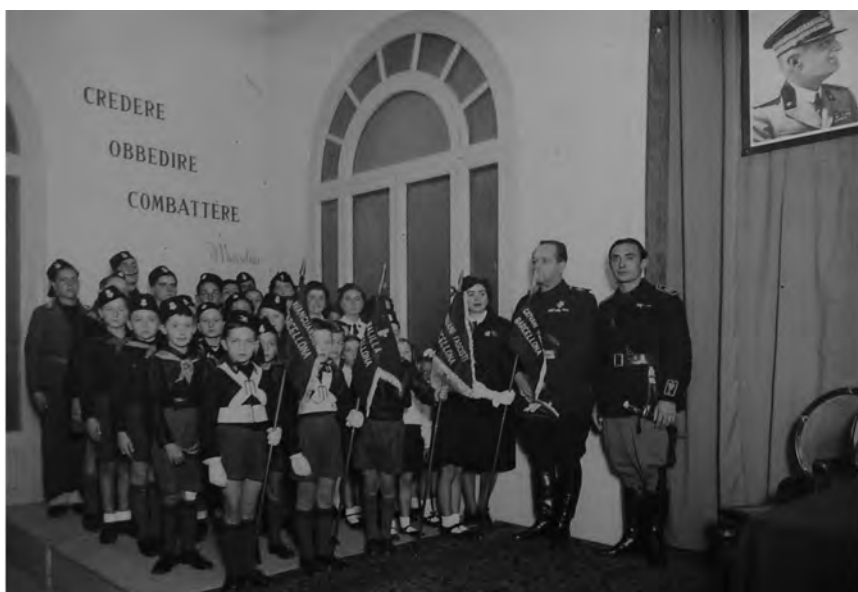
Imag. 17. Comando de la GILE de Barcelona, agrupado bajo el lema mussoliniano «Crederre, obbedire, combattere», 04 de noviembre de 1939.