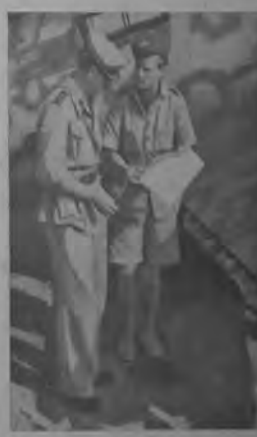
Compagno di Vals sul fronte dell'Italia Meridionale.

A proposito degli azeri nella propaganda tedesca che agita incessantemente il pericolo delle infiltrazioni sovietiche in Italia come conseguenza della conferenza di Mosca, nei circoli politici di Napoli si osserva che l'Italia mantiene sempre relazioni diplomatiche con la Russia anche dopo la Rivoluzione sovietica e che, fra l'altro il Governo fascista fu il primo in Europa a riconoscere la Repubblica sovietica senza che questo costituisse un pericolo per l'organizzazione politica italiana. In quei circoli si fa inoltre notare che anche durante il periodo di maggior monarchia che precedette l'avvento del fascismo, l'Unione Sovietica della Russia era insignificante. Al contrario si osserva a Napoli — la condotta politica e militare della guerra di Hitler, l'elemento più favorevole per lo sviluppo dei germi di anarchia e di ribellione che esistono in ogni paese. Una stanchezza di sottilezza che le persecuzioni contro i cattolici nei paesi occupati dalla Germania sono di carattere più violento e più brutale della stessa campagna antireligiosa comunista. La guerra alleata con i nemici tedeschi e il miglior alleato del bolscevismo che non è un proleto russo ha aspettato, ma che mise spontaneamente nel paese quando si determinano le circostanze lavorative.