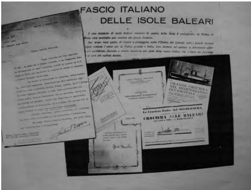
Imag. 4. Fotomontaje sobre el Fascio de las Baleares con documentos de 1926 (CDMH, PS, Barcelona, legajo 272, expediente 32).