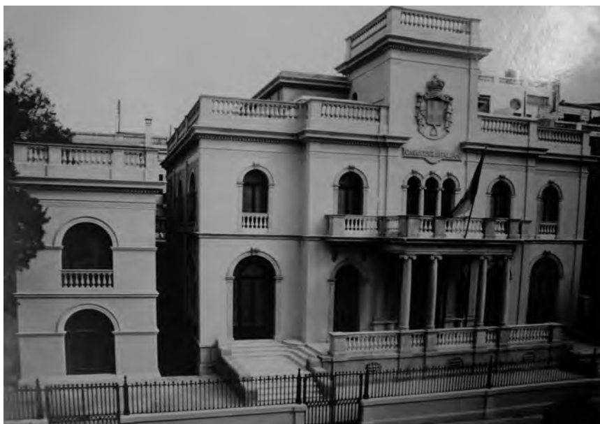
Imag. 1. Fachada de la Casa degli Italiani de Barcelona en 1924 antes de la reforma del edificio