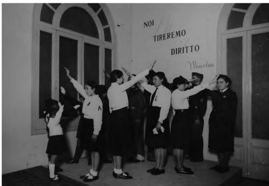
Imag. 18. Comando de la GILE de Barcelona, haciendo el saludo fascista bajo el mussoliniano “Noi tireremo diritto”, 04 de noviembre de 1939 (ASMAE, DGRC-AS , I versamento 1936-1945, b. 114).