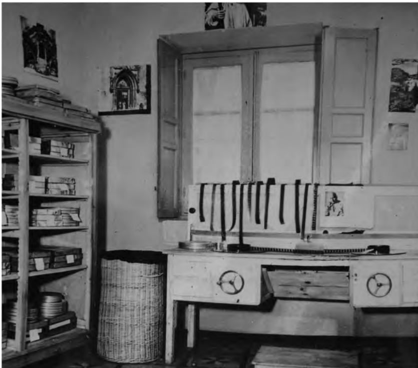
Imag. 10. Dependencias de la oficina de prensa y propaganda en Salamanca. Revelado fotográfico y rollos de proyecciones cinematográficas (ACS, Minculpop , DGP, b. 208).