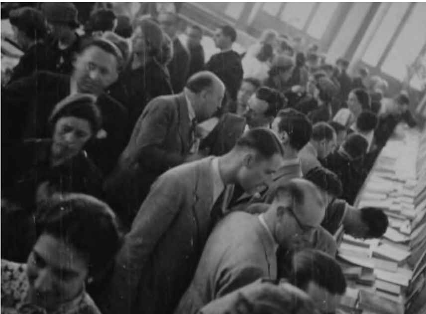
Imag. 14. Muestra del libro italiano coincidiendo con los cursos de verano de Santander, 1939. Profesores y público.