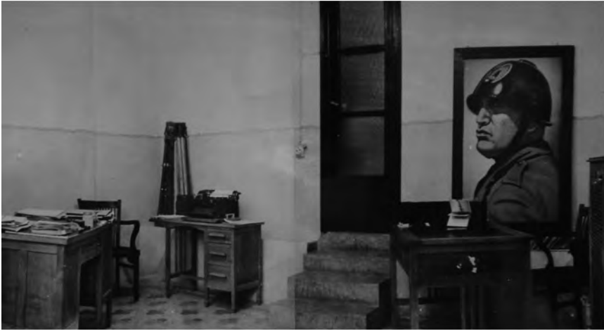
Imag. 11. Dependencias de la oficina de prensa y propaganda en Salamanca. Mesas con máquina de escribir y retrato de Mussolini (ACS, Minculpop , DGP, b. 208).