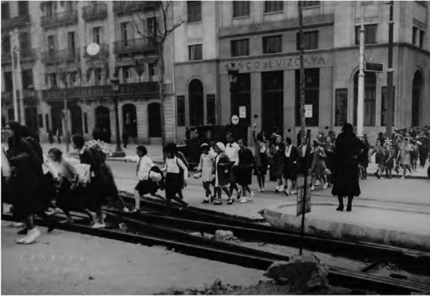
Imag. 5. Protestas contra alumnos de la escuela italiana. Participantes en la excursión de Avanguardisti, Balilla y Piccole Italiane, 23 de marzo de 1933.