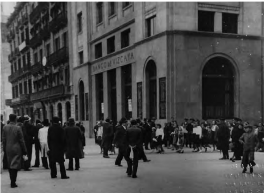
Imag. 6. Protestas contra alumnos de la escuela italiana. Encuentro de los antifascistas con los excursionistas, 23 de marzo de 1933 (ASMAE, AS, 1929-1935, b. 834).