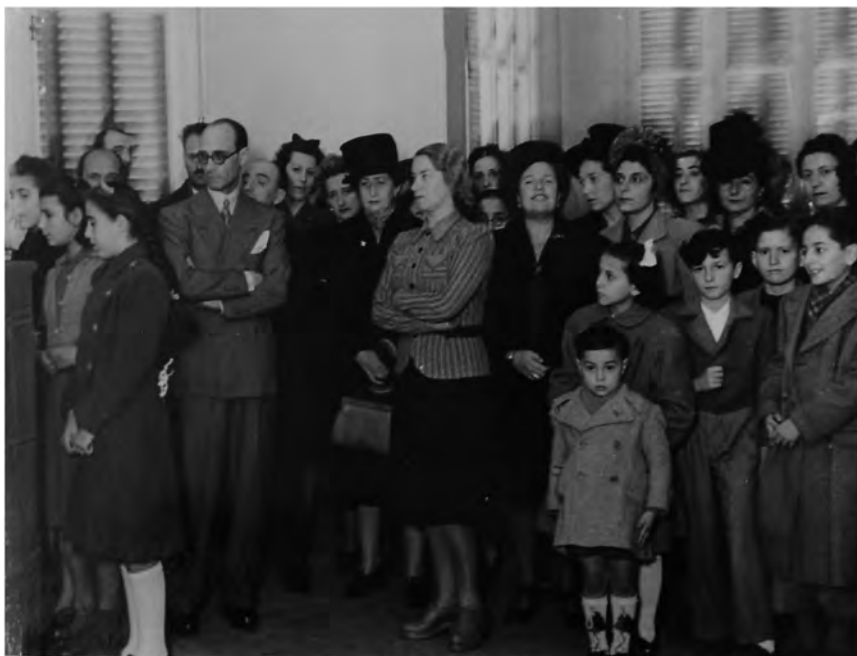
Imag. 23. Entrega de obsequios entre la comunidad italiana de Madrid por la embajada monárquica, diciembre de 1944 (ASMAE, DGRC-AS , I versamento 1936-1945, b. 115).