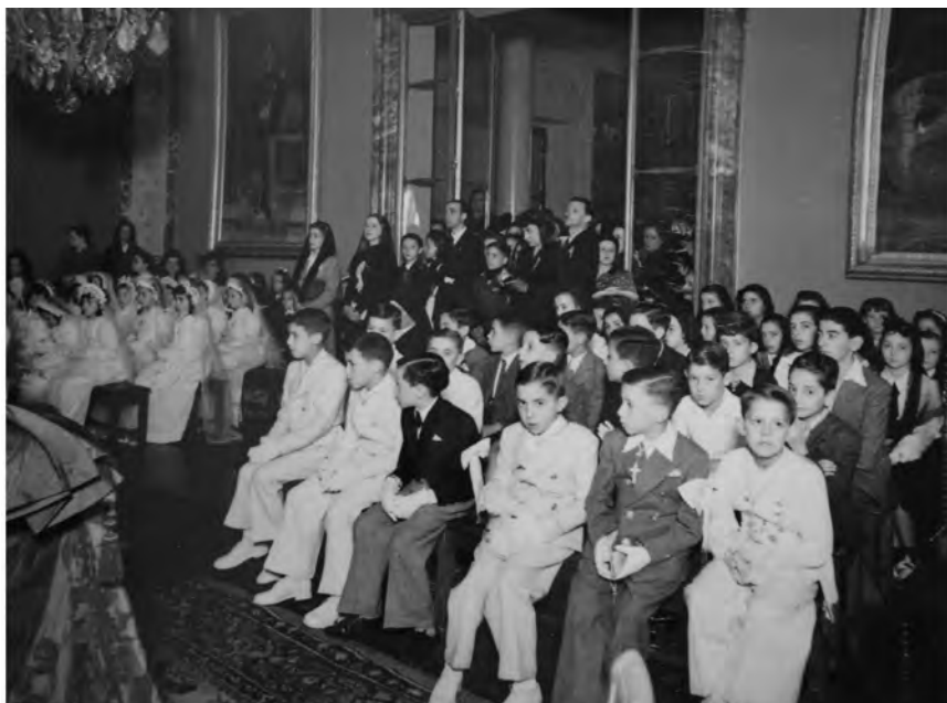
Imag. 20. Primera comunión impartida por el Nuncio en Madrid, monseñor Cicognani, a alumnos de las escuelas italianas en Madrid, 30 de mayo de 1943 (ACS, Minculpop , DGP , b. 207).