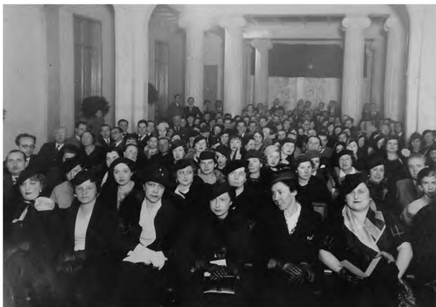
Imag. 8. Asistentes a un concierto organizado por la colonia italiana de Barcelona en 1932 (ASMAE, AS, 1929-1935, b. 882).