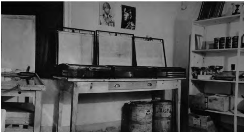
Imag. 12. Dependencias de la oficina de prensa y propaganda en Salamanca. Material para la elaboración de la propaganda (ACS, Minculpop , DGP, b. 208).