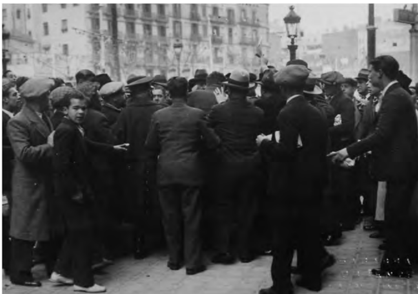
Imag. 7. Protestas contra alumnos de la escuela italiana. Encuentro de los antifascistas con los excursionistas, 23 de marzo de 1933.